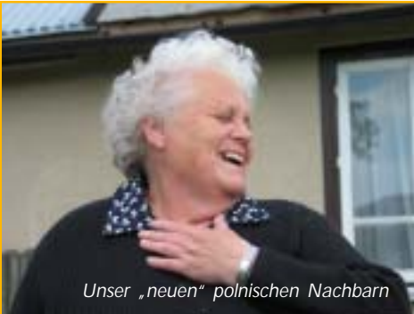
Unser „neuen“ polnischen Nachbarn